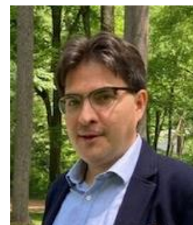
Cyrille Payot © DR