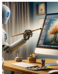
Légende accompagnant l'illustration.