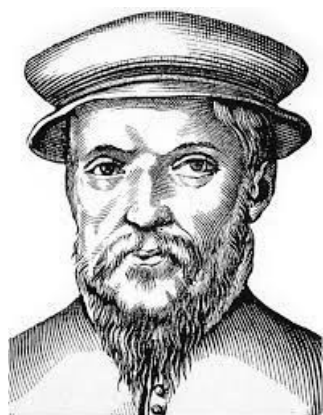
Claude Garamond 1500-1561

Il est très probablement l'auteur des caractères passés à la postérité sous le nom de son disciple